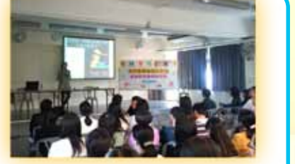
團體選取合適內容(可選多項)，建議工作坊/講座約一小時，加插過來人分享環節約一小時三十分鐘

近年本港毒品事件頻仍，青少年成為受害者眾，為家庭、教育以及社會風氣帶來巨大挑戰。本中心為各界提供相關社區教育培訓，辨識及處理青少年有關毒品問題的困擾，協助他們處理成長階段的困難，以拒絕毒品的誘惑。上述培訓活動費用全免，內容如下： • 青少年吸食危害精神毒品的原因 • 校園自願驗毒計劃 • 青少年吸食危害精神毒品的最新趨勢及文化 • 涉及學生吸毒問題的處理原則及重點 • 辨識吸食危害精神毒品的技巧及方法 • 探討成癮行為，預防及介入的原則 • 個案評估及處理 • 社區戒毒服務資源分享