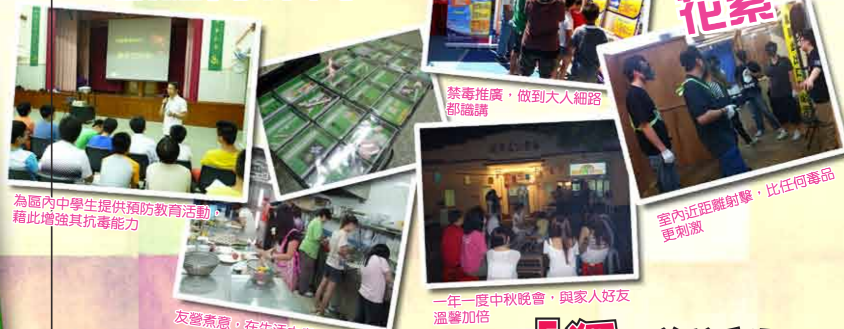
為區內中學生提供預防教育活動，藉此增強其抗毒能力